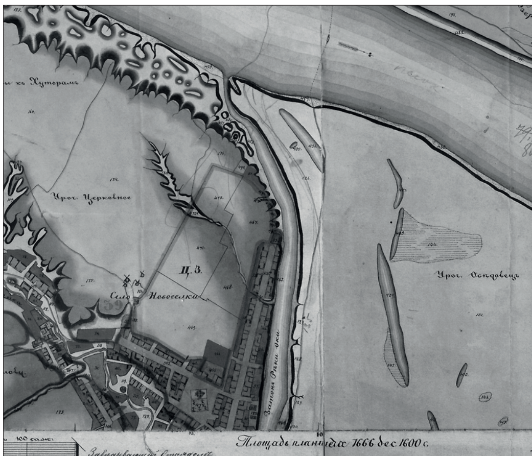
Фото 3. С. Новосёлки и Обедовец. Ока течет ещё в старом русле. Межевой план сер. XIX в. ГАРО. Ф. 892. Оп. 2. Д. 965