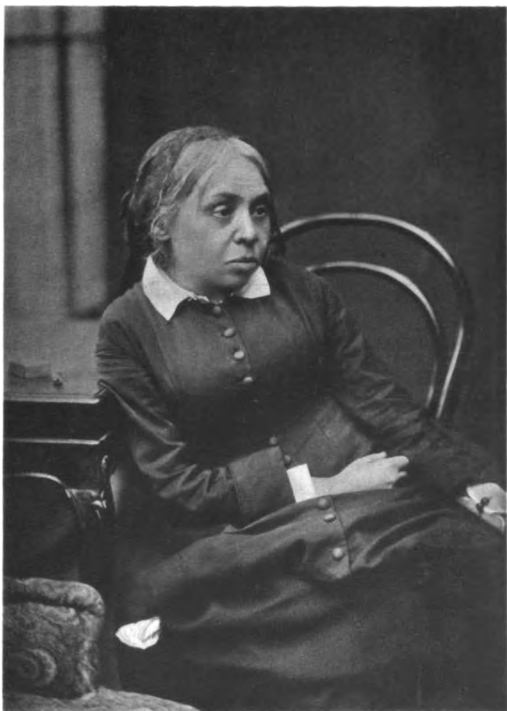
1880-е гг.